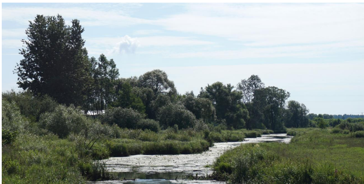
Roślinność wzdłuż Rządzy Rasztowskiej

Łąki i pastwiska tworzące półnaturalne zbiorowiska otwarte, są miejscem występowania wielu rzadkich i chronionych gatunków roślin i zwierząt oraz istotnym składnikiem krajobrazu kulturowego.